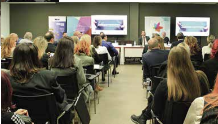
Друштвени дијалог Мултикултуралност и интеркултуралност у републици Србији - добре праксе и изазови 17. новембар 2023.