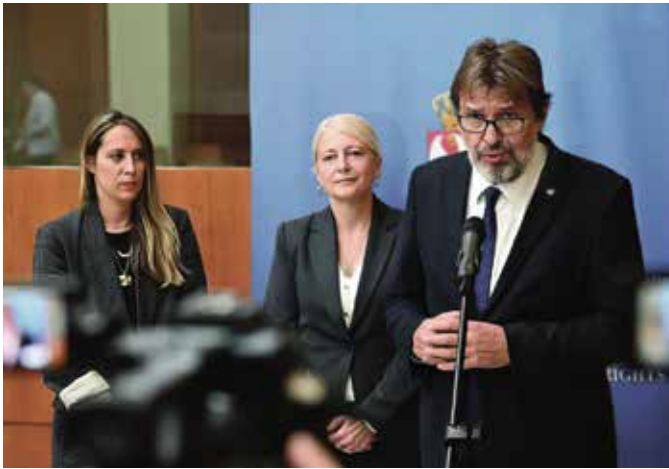
Друштвени дијалог „Укључивање жена и девојака у технолошке и друштвене иновације - изазови у развоју институционалног оквира“ 25. октобар 2023.

Од 2021. до јула 2024. године Министарство за људска и мањинска права и друштвени дијалог спровело је више друштвених дијалога о родној равноправности током којих су дефинисана стратешка законска решења у области родне равноправности у сфери економије (тржиште рада, предузетништво, пољопривреда и село), родне равноправности у области образовања (планови и програми наставе и учења), социјалне и здравствене заштите, једнаких могућности за приступ роби и услугама, као и учешћа у политичком деловању и јавним пословима.