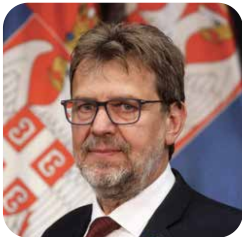
Томислав Жигманов Министар за људска и мањинска права и друштвени дијалог