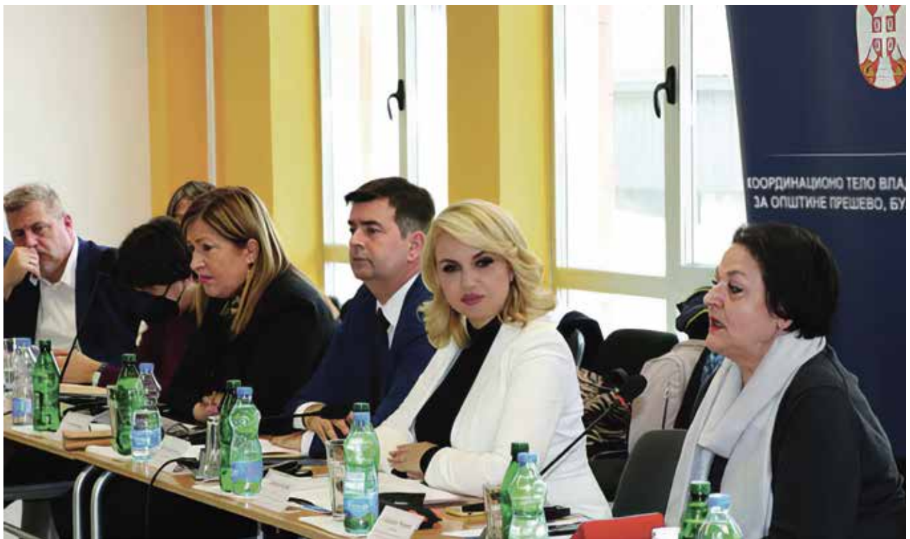
Друштвени дијалог План од 7 тачака - Интеграција у државне институције 11. март 2022.

Са уверењем да је друштвени дијалог најбољи начин за решавање проблема и успостављање поверења између представника Албанаца и институција Републике Србије, Министарство за људска и мањинска права и друштвени дијалог, у сарадњи са Координационим телом Владе Републике Србије за општине Прешево, Бујановац и Медвеђу, покренуло је друштвене дијалоге на тему имплементације мера за афирмацију права албанске националне мањине дефинисаних у Плану од 7 тачака усвојеном 2013. године.