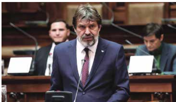
Друштвени дијалог Међународни дан људских права - Да нико не буде изостављен 10. децембар 2022.

Дијалози су обухватили расправе о најразноврснијим темама у домену заштите људских права – попут стања у области родне равноправности, забране дискриминације, истополних заједница, стратегије развоја образовања и васпитања, социјалне заштите, јачања положаја Рома и Ромкиња, културе дијалога, циљева одрживог развоја, социјалног предузетништва, међугенерациске солидарности, додатних психолошких и психијатријских сервиса, достојанственог рада у медијима и одговорног новинарства. Спроведени друштвени дијалози били су медијски пропраћени учешћем великог броја представника различитих врста медија.