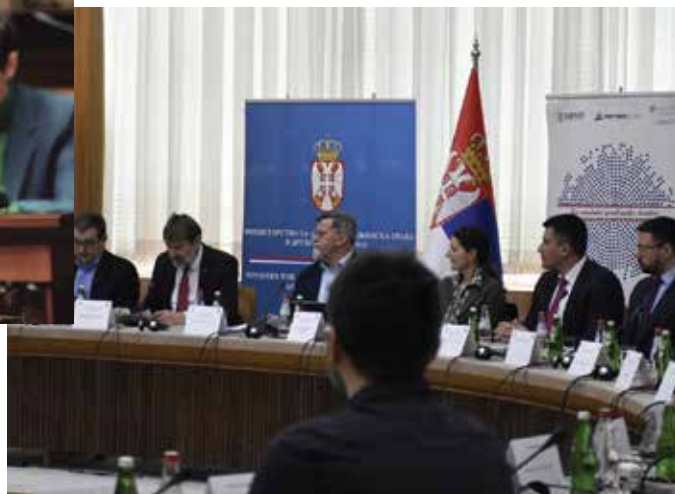
Друштвени дијалог Филантропија као давање за опште добро - Унапређење подстицајног оквира 5. март 2024.