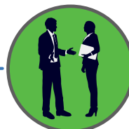
САГЛАСНОСТ О ПОСТУПАЊИМА