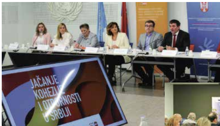
Друштвени дијалог Улога компанија у заштити и промоцији људских права и социјалној инклузији у Републици Србији 23. децембар 2022.

Министарство за људска и мањинска права и друштвени дијалог је од 2021. до 20. јула 2024. године организовало 57 друштвених дијалога, са више од 3.500 учесника из државних органа, институција, скупштинских и независних тела и судова, међународних организација, националних савета националних мањина, школа, факултета, универзитета, института, дипломатских представништава, верских заједница, медијских удружења, организација цивилног друштва, синдиката, јединица локалне самоуправе, републичких и покрајинских јавних служби и установа, посланика и Скупштине АП Војводина и секретаријата АП Војводина.