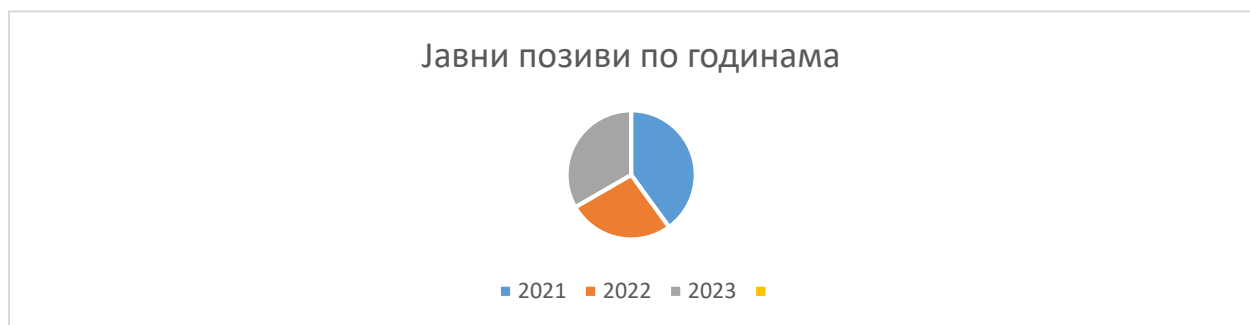
Графикон 1. Преглед расписаних Јавних позива по годинама

Када је у питању број организација које су показале заинтересованост за учешће у процесима израде и доношења прописа и докумената јавних политика, односно оних које су учествовале у јавним позивима у 2023. години, укупно је поднета 141 пријава од стране 88 различитих ОЦД-а у оквиру 15 јавних позива. Од наведеног броја пријава предложено је за укључивање у радна/саветодавна тела 100 чланова и 90 заменика чланова из 62 различите ОЦД (поједини јавни позиви имали су за циљ само избор члана не и заменика члана). То практично значи да је око 70% заинтересованих организација за учешће у процесу израде прописа и документа јавних политика предложено за именовање у радним групама/саветодавним телима.