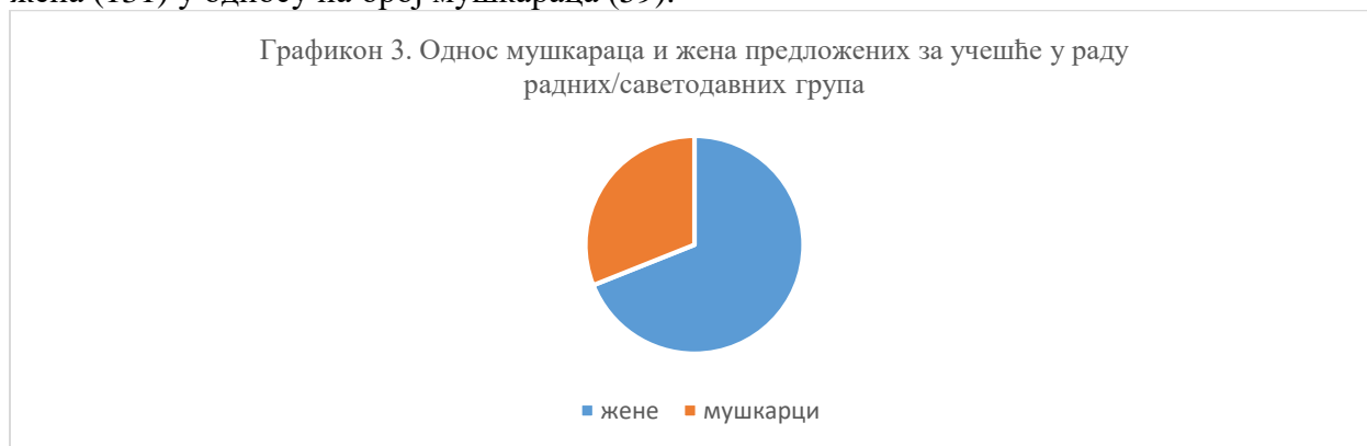
Графикон 3. Однос мушкараца и жена предложених за учешће у раду радних/саветодавних група

Значајно је надаље истаћи да је у четири јавна позива предложен, а потом и именован у радну групу, већи број представника ОЦД од оног који је планиран јавним позивом.